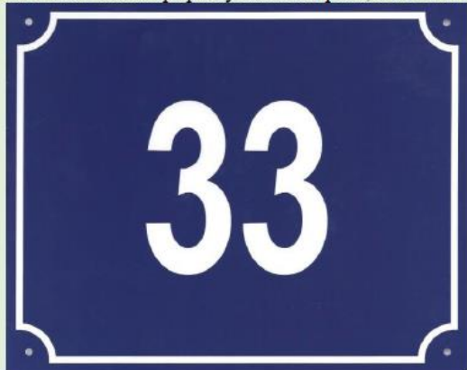
Tabulka s číslem popisným modré pole, bílé číslice