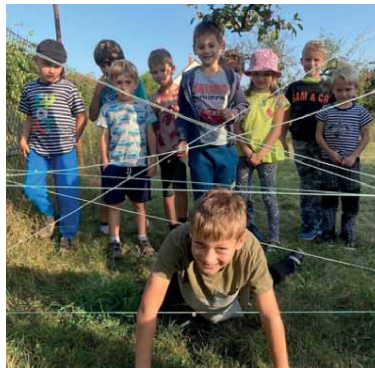
Začali jsme s velkou chutí – oddílová schůzka

Náš nový skautský rok začal tak slibně. Už 1. září jsme měli první oddílovou schůzku. S velkou chutí a zápalem jsme se pustili se staršími dětmi do plnění úkolů skautského Nováčka a zahájili plavby Čolka a Žabky. Zářijové počasí nám přálo. Na zahradě farního centra jsme si vyzkoušeli spoustu nových her a s radostí si užili i ty osvědčené. Starší děti předškolního a školního věku už vytvořily hned několik družin a připravovaly se, že z nich vznikne postupně nový oddíl vodních skautů Luňák. Mladší školkové děti, sourozenci luňáků, trávily čas tvořivě na dvoře fary s rodiči. Pro všechny zájemce jsme se po oddílových schůzkách začali učit hrát na kytaru a ukulele, abychom nebyli za „mastňáky“ a „pad'oury“ u táborových ohňů. Bohužel po šesté oddílové schůzce byla činnost celé naší organizace opět přerušena z důvodu protiepidemiologických opatření.