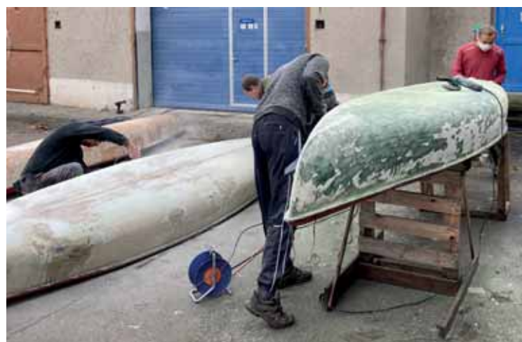
Opravujeme staré lodě – brousit laminát bez roušky ani nejde

ního věku a žáky 1. ročníku, kteří zvládali jen s obtížemi úskalí distanční školní výuky, nemělo smysl připravovat on-line program. Ten by zaměstnal víc rodiče než samotné děti. Dali jsme si tedy nucené skautské prázdniny.