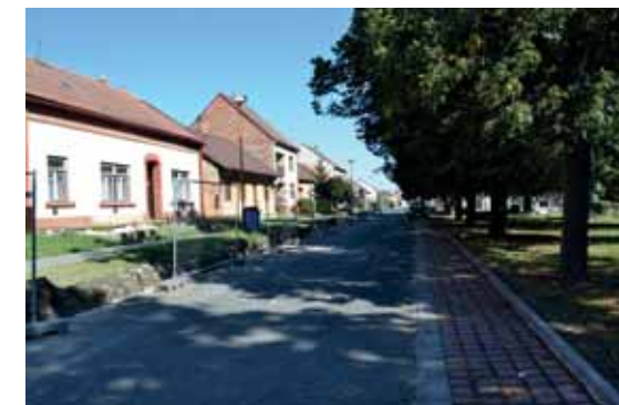
Rekonstrukce vozovky Velkomoravská Obnova hřbitovní zdi Amfiteátr Lužák