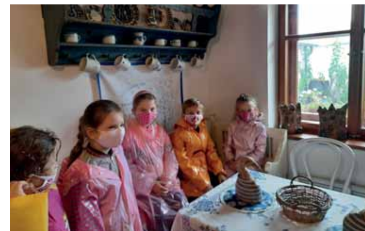
Žáci ZŠ Lužice na Starém kvartýru