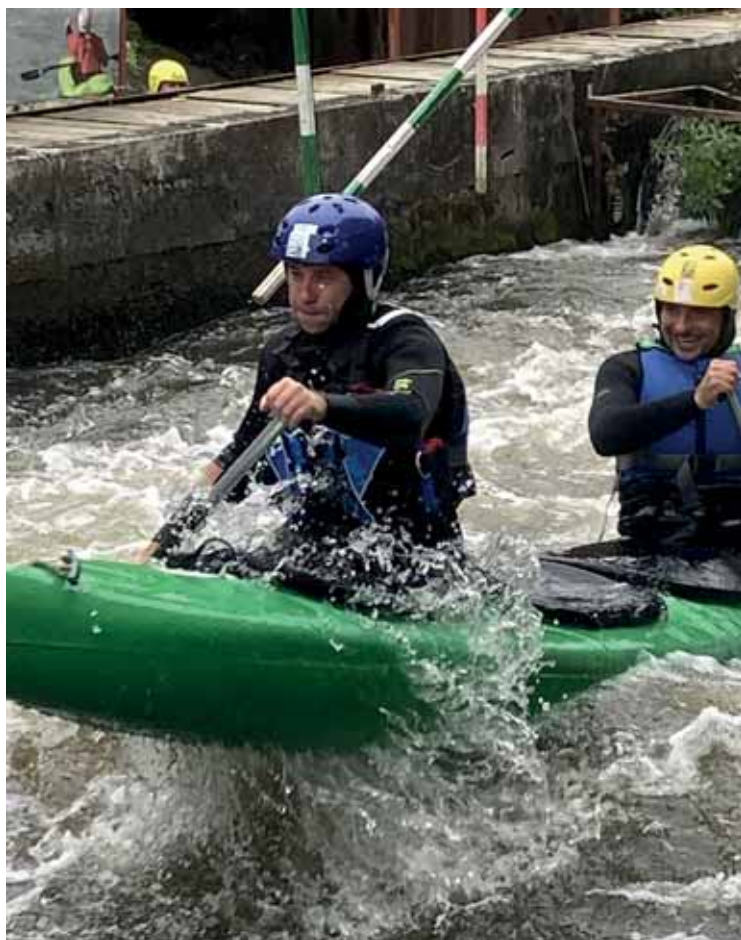
Výcvik na slalomovém kanále v Brandýse nad Labem