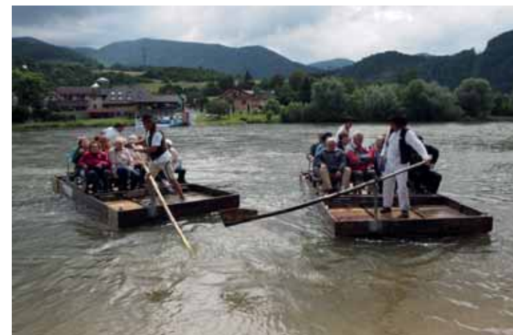
Plavba na pletích pod Strečnom

13.–19. 9. 2021 Doksy – hotel Bellevue: Městečko Doksy leží na břehu Máchova jezera, okružní plavby lodí po jezeře nabízejí nádherné výhledy do okolí. Ubytování ve dvoulůžkových pokojích, plná penze, výlety do okolí.