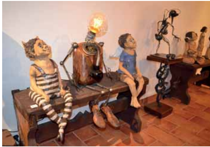
Výstava Propojení na Starém kvartýru

Jaký by to byl rok, kdybychom se nemohli zúčastnit tradičních hodů. I letos se po dlouhém váhání všech pořádajících nakonec hody uskutečnily. Po minulém roce, kdy nás zradilo zelené, a taky kvůli rekonstrukci Sokolovny, která znemožnila případnou variantu, se hody odehrály pod stodolou v areálu Lidového domu. Po domluvě s krojovanými byly hody zkráceny na dva dny. V sobotu 4. 7. proběhl předhodový večer a v neděli