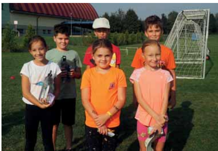
Memoriál Štěpána Kurky

Také letošní devátáci se fotografovali v krojích. Poslední zářijový den za pomoci ochotných žen se oblékli do krojů a stali se modely