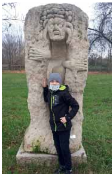
Pátračka po Lužicích