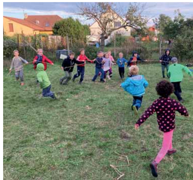
Rybičky, rybičky, rybáři jsou hned lepší se síti