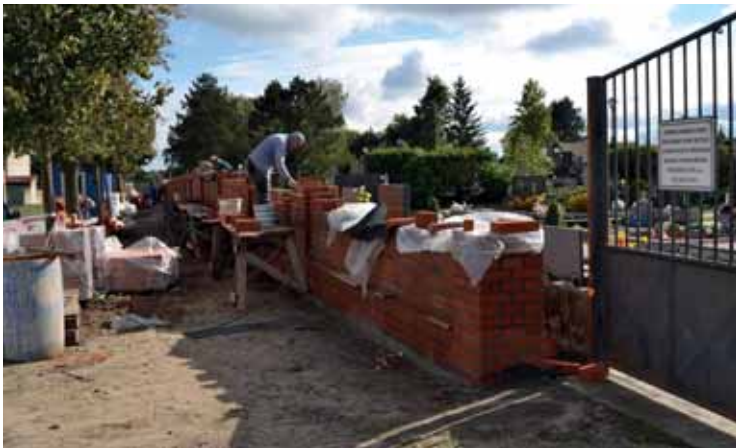
Obnova hřbitovní zdi

V tomto směru byl končící rok 2020 velice úspěšný a podařený. A to navzdory všem nepříznivým okolnostem, mimo jiné i poklesu příjmů obce. Celý rok jste byli s průběhem všech investic seznamováni, proto nyní jen telegraficky. Rekonstrukce Sokolovny (29,5 mil. Kč), vybavení Sokolovny – stoly, židle, sportovní nářadí (2,2 mil. Kč), Sokolovna – jevištní osvětlovací a zvuková technika, kamerový systém (0,7 mil. Kč), ulice Záhumenní – nové veřejné osvětlení (3 mil. Kč), chodník na ulici Ploštiny (1,3 mil. Kč), místní komunikace Velkomoravská – rekonstrukce vozovky (2,9 mil. Kč), obnova hřbitovní zdi – 2. etapa (1,7 mil. Kč), demolice zbytku kina (1,4 mil. Kč), úprava prostranství v centru obce (0,8 mil. Kč), rekonstrukce kotelny v budově školní družiny (1,2 mil. Kč), amfiteátr na Lužáku (0,7 mil. Kč). Poslední uvedená akce bude dokončena v roce 2021. Z tohoto přehledu je snadno