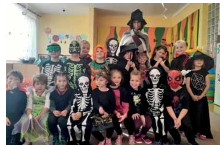
Halloween v mateřské škole

Za kolektiv mateřské školy Monika Štylárková