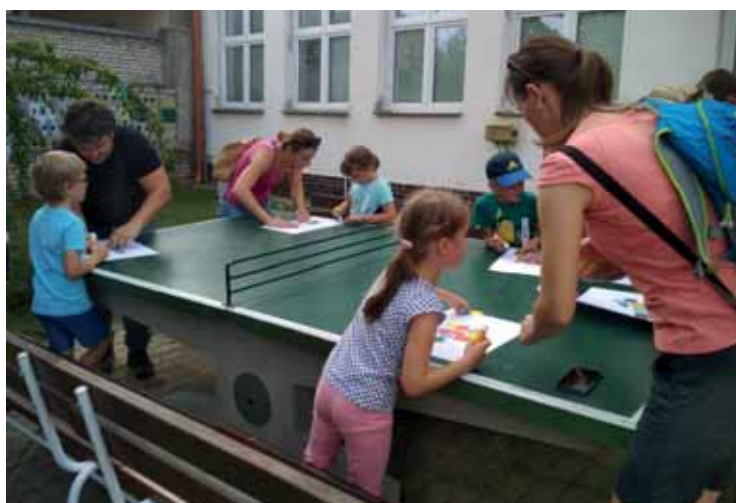
Zábavné odpoledne s prvňáčky