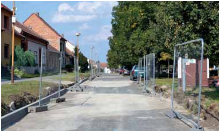
Oprava komunikace Velkomoravská