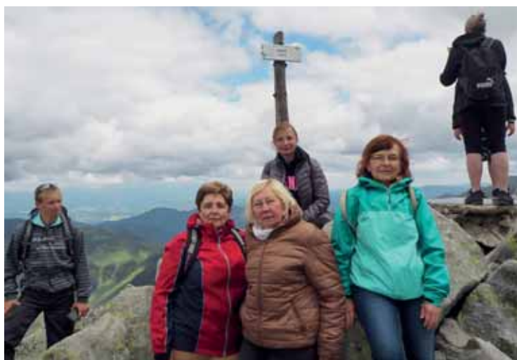
Zvládli jsme to!