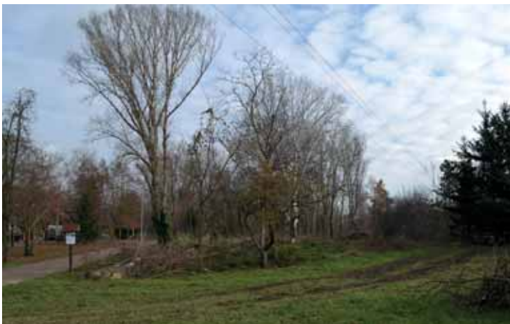
Revitalizace veřejné zeleně u kapličky

V těchto dnech již dochází ke kácení vyznačených stromů, v led-