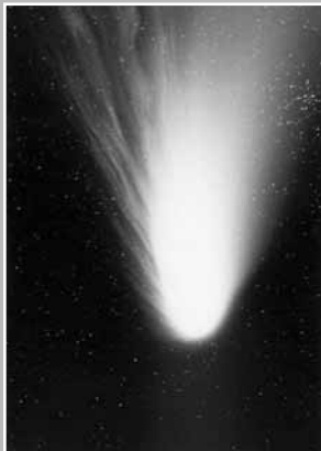
„Takto zachytili kometu Hale-Bopp v dubnu 1997 čeští astronomové na Kleti“.

Jednou z nejznámějších atrakcí letní oblohy jsou v polovině srpna tzv. Perseidy. Evropa si jejich maxima letos užila v noci z 12. na 13. srpna. Den předtím navíc nastal měsíční nov, takže obloha byla jaksepatří tmavá. O co se vlastně jedná? Jsou to malé částice (meteoroidy), vstupující do zemské atmosféry rychlostí až 60 km/s. Vidíme je jako tzv. padající hvězdy, protože v atmosféře shoří. Ve Sluneční soustavě se pohybují jako rozptýlená vlákna částic přibližně po dráze jejich mateřské komety 109P/Shift-Tuttle a se Zemí se střetávají pravidelně v období od 17. července do 24. srpna. Letos byla frekvence Perseidů 100 meteorů za hodinu, v příštím roce díky vlivu planety Saturn na dráhu meteoroidů bude jejich frekvence 110 až 120 meteorů za hodinu.