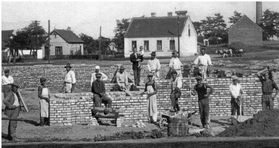
Stavba Sokolovny, červen 1930