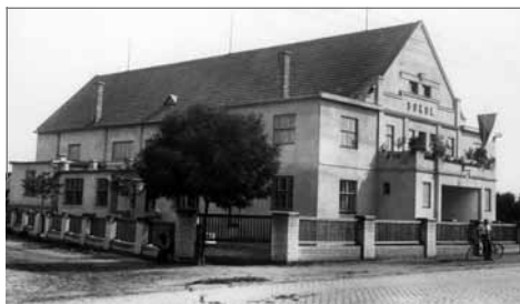
Budova Sokolovny v roce 1938