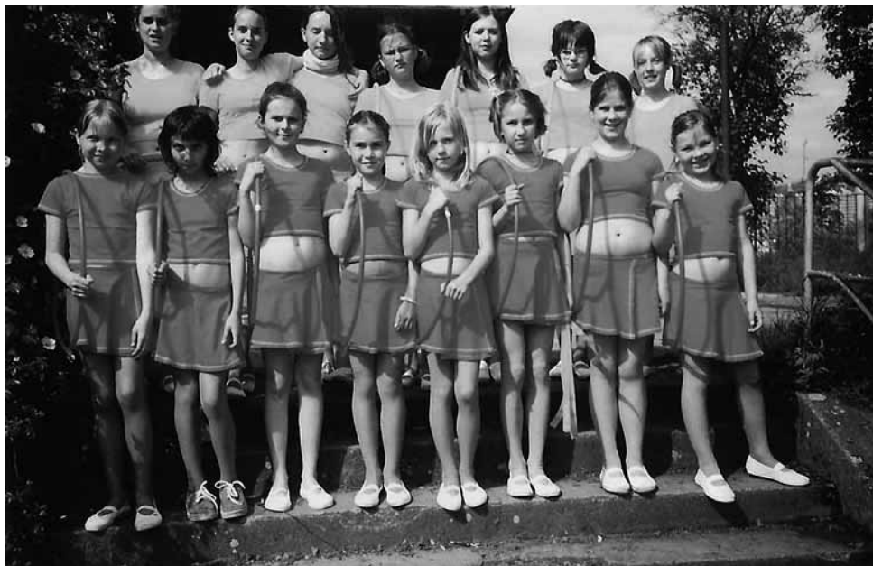
Žačky Sokola Lužice na předslětovém veřejném cvičení v Morvském Písku dne 11. 6. 2006