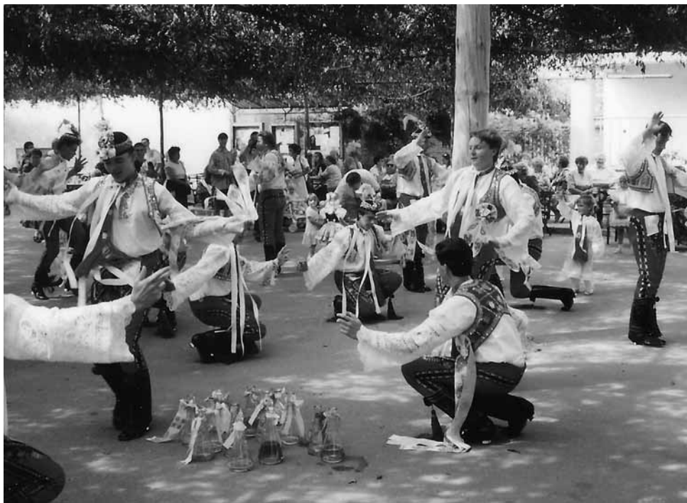
Hody Lužice 1992, domácí chasa při zahajovacím verbuňku

ko, Horňácko, Strážnicko a Uherskohradištsko s Uherskobrodskem). Lužické patrioty jistě potěší, že na videokazetě věnované Podluží je několik pasáží, ve kterých jmenovitě figuruje naše obec nebo naši rodáci. Jedná se zejména o záběry z částečně inscenovaného natáčení na lužických Cyrilských hodech (v roce 2001), záběry Lužičanů jakožto přespolečáků na hodech v Dolních Bojanovicích (2000), záběry z natáčení ve Tvrzonicích a ve Staré Břeclavi, z verbířské soutěže ve Strážnici nebo z inscenované krojové svatby v Hlohovci (1997).