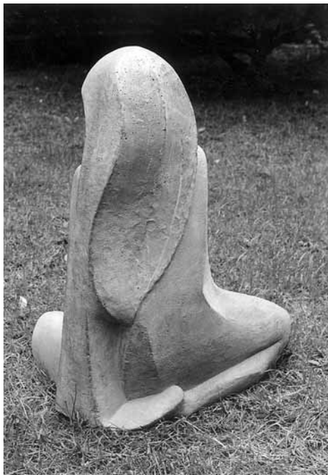
Jan Buchta, Sedící dívka, uměly kámen 2001

p. starosty a místostarostky, budu se snažit uspořádat symposium v Lužicích, aby se i obec mohla zařadit mezi ojedinělá místa v republice, kde se symposia konají. Chtěla jsem i pro Lužice a vás občany něco dalšího ze své profese výtvarníka a pedagoga udělat. Starosta a místostarostka na-