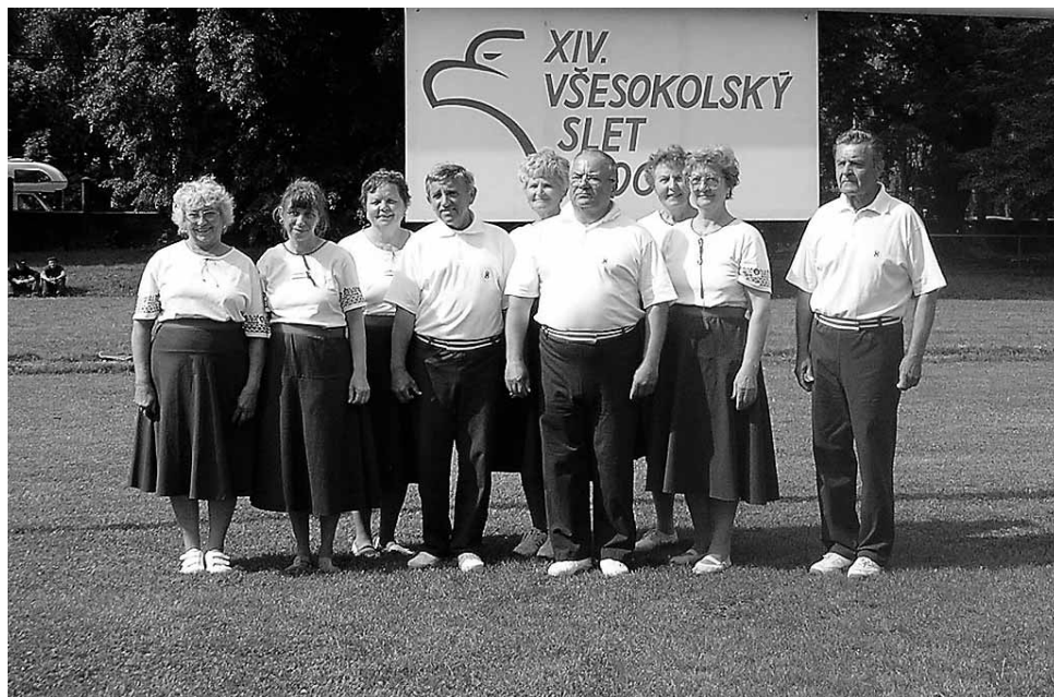
„Věrná garda“ zdraví všesokolský slet