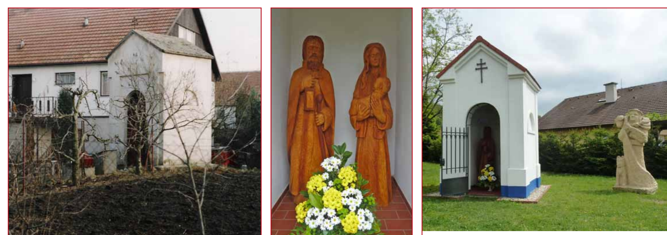
Kaplička v zahradách domů v ulici Dvorní, 1998