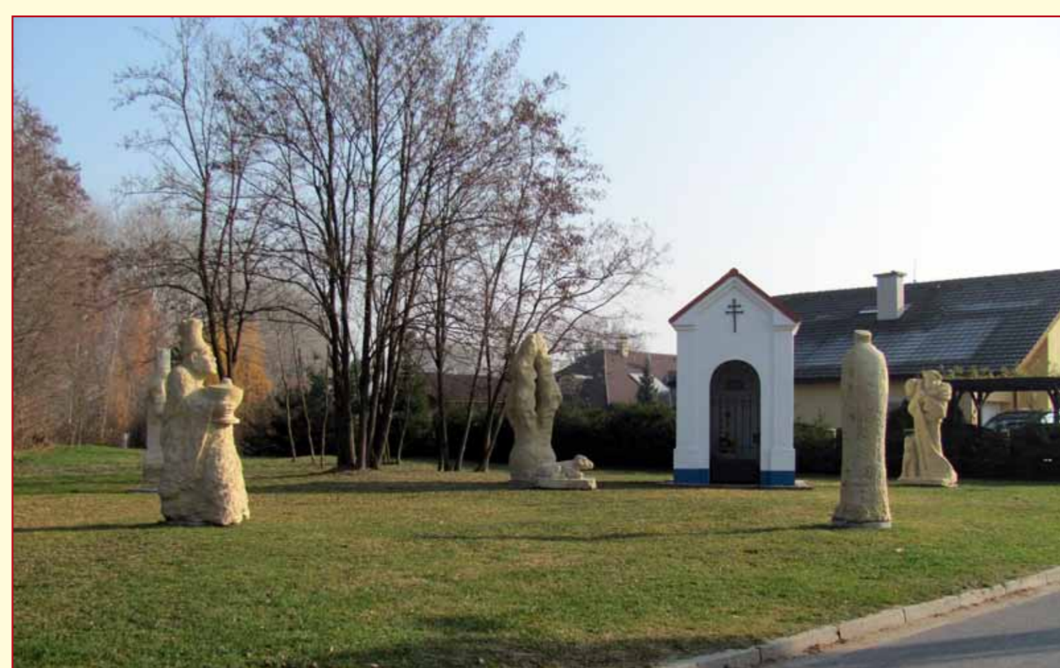
Sochy u kapličky