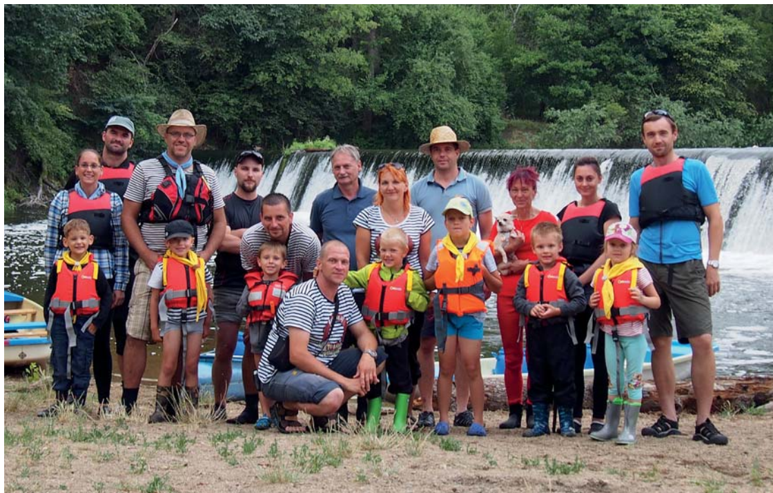
Znojenská Dyje, účastníci výpravy