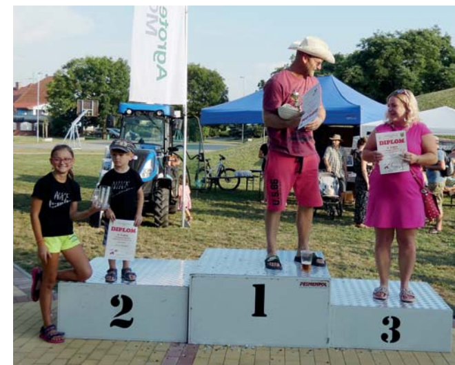
Vítězové Pekáčku 2019