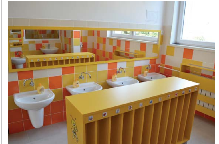
Rekonstrukce sociálních zařízení v MŠ

Jsem rád, že jsme přes prázdniny zvládli realizovat všechny záměry související se školními budovami. Žáky školy tak na začátku září přivítaly nové šatny se šatními skříňkami, nové školní dílny s vybavením pro technickou výuku, z hlediska stavu budovy došlo k opravě a výměně hřebenáčů na staré budově školy a k výměně všech dešťových svodů. V mateřské školce se podařilo kompletně zrekonstruovat sociální zařízení dvou tříd včetně