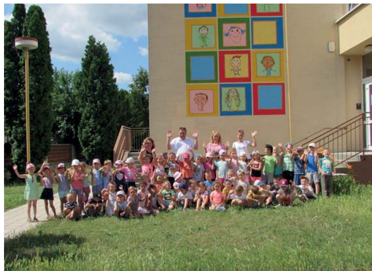
Nová fasáda budovy MŠ

Dne 5. 9. proběhne jako každý rok rodičovská schůzka, tentokrát s ochutnávkou pomazánek, aby