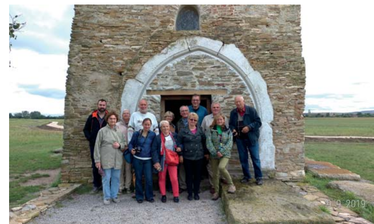
Přátel z Isdesa