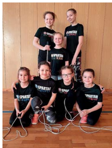
Závody ve skákání přes švihadlo

Cvičení je zaměřeno spíše na všestrannost a sportovní hry. Nejvíce děti baví překážkové dráhy, hry na