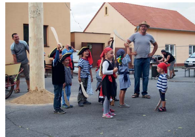
Malí piráti na hodech