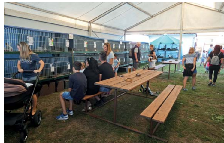
Výstava králíků, drůbeže a holubů