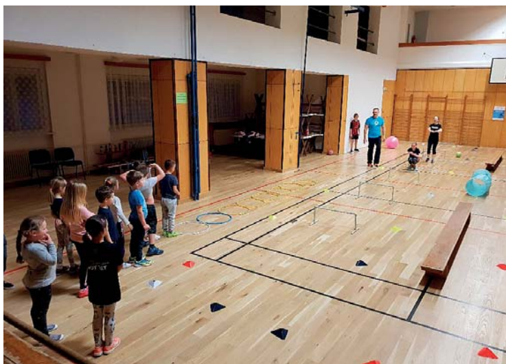
Trénink v Sokolovně

hřišti a naše nejoblíbenější ocásky /honěná v naší úpravě/. Starší děti už zvládají silové cvičení a kruhové tréninky. V rámci různých sokolských závodů, které se konají v průběhu celého roku, jsme zatím zvládli jen závody v přeskočení přes švihadlo, kde nás reprezentovalo 6 dívek. Přivezli jsme dvě medaile v nejstarší kategorii, a to 2. a 3. místo. V běhu Velkými Bílovicemi