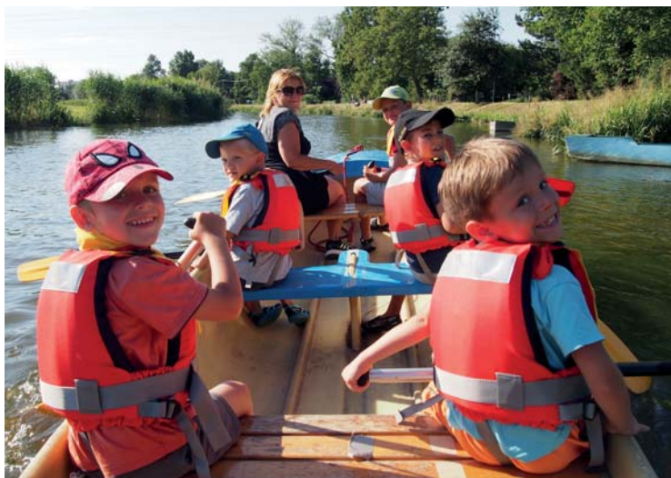
Trénink vodních skautů z Lužic na Moravě

kontakt: 775 662 298, miroslav.havlik@seznam.cz fotogalerie oddílu: zonerama.com/SkautiLužice/ webové stránky oddílu: luzice.skauting.cz