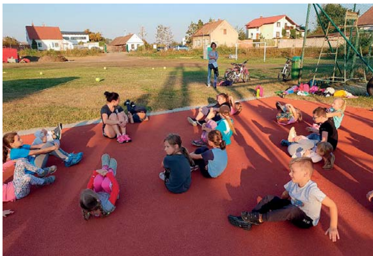
Trénink na workoutu