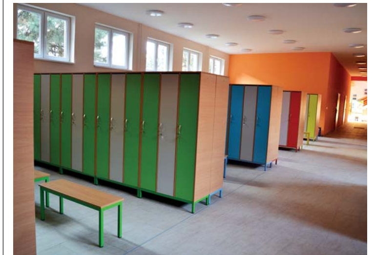
Nové šatny v budově ZŠ